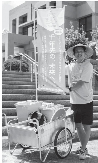
▲たったひとりのエコマラソン出発。現在も少しずつ、宮古島を綺麗にしながらかみ続けています。

『宮古島が千年先の未来も美しい島であるために、小さなエコを続けていきます。もっと宮古島を盛り上げていけるようがんばります！』